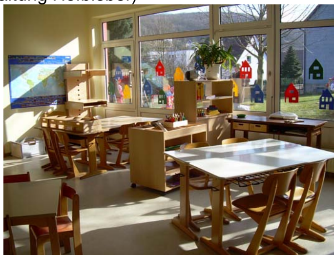
Blick in die Hortgruppe

Alle den Hort betreffenden Informationen, wie z.B. Platzsplitting, Kosten, Hausaufgabenbetreuung, Freispielzeit etc. können im „Konzept kommunaler Kinderhort Hofbieber“ nachgelesen werden. (erhältlich in der Kindertageseinrichtung Hofbieber oder der Gemeindeverwaltung Hofbieber)