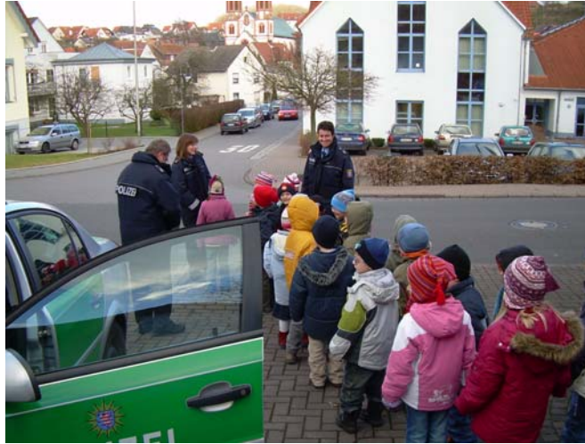
Verkehrserziehung mit der Verkehrspolizei